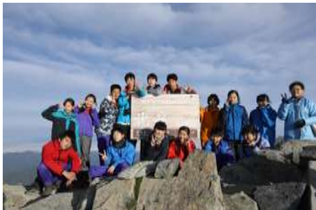
7月10日 北岳山頂にて。