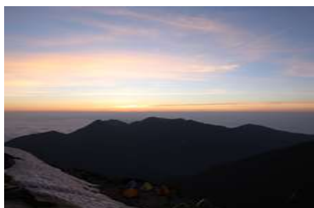
7月10日午前4時30分。肩の小屋より。