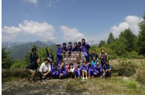
自然パトロール。夜叉神峠にて。