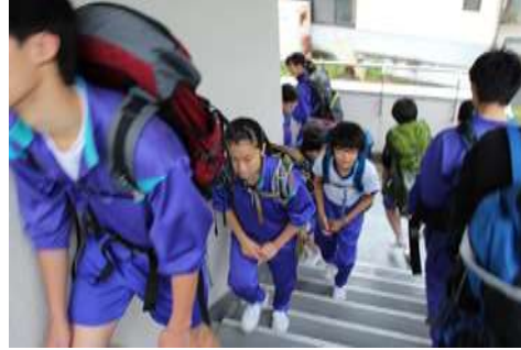
雨の日は校舎内でトレーニング。