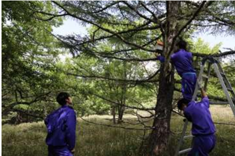
自然パトロール。巣箱設置作業。