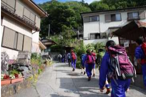
晴れた日は学校周辺でトレーニング。