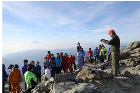
清水様より北岳の歴史について。