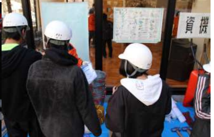
○災害ボランティア講習会 大災害が起きた想定で中学生として協力しました。7名が自主的に参加しました。