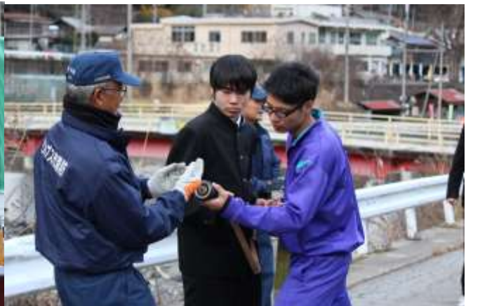
○避難訓練 抜き打ちで火災を想定して実施。消防署の方より初期消火と消火栓の使い方を学びました。