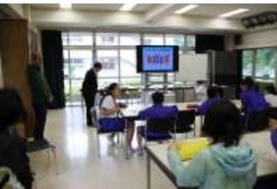
6/18 ネットモラル教室