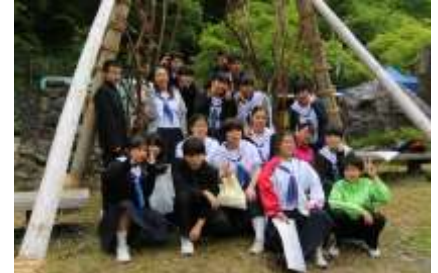
6/23 開山祭 式典を終えて