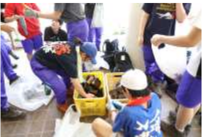
6/22 自然パトロール ごみの分別