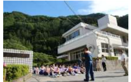
6/29 避難訓練 消防署員の方より