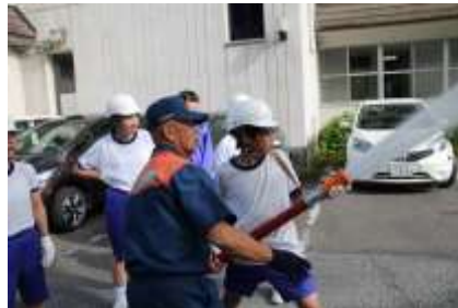
6/29 避難訓練 放水訓練