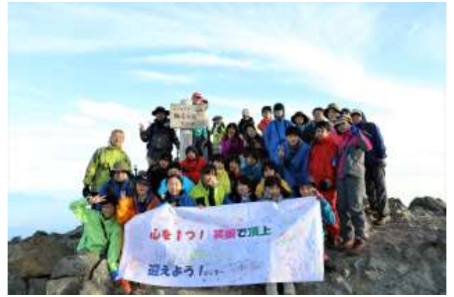
7/17 全校登山 仙丈ヶ岳 山頂で