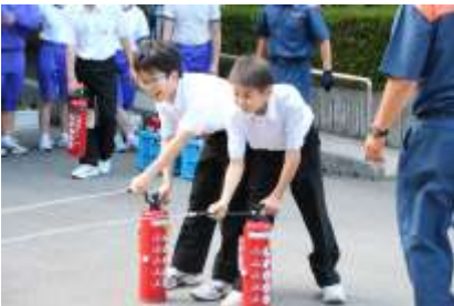
6/29 避難訓練 初期消火訓練