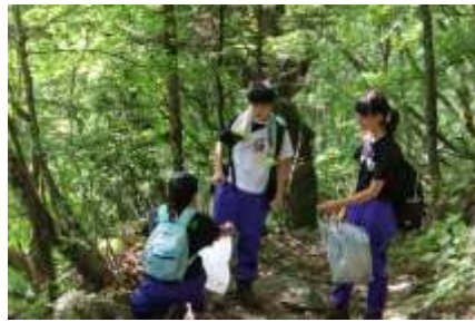
6/22 自然パトロール 登山道の清掃