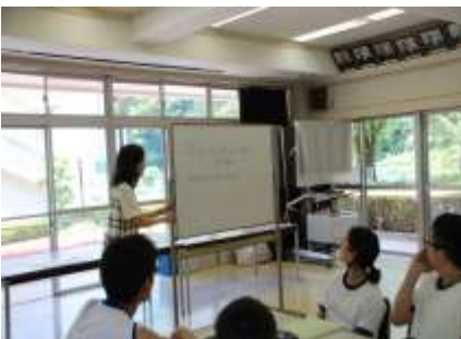
6/29 英会話科ディベート テーマ提示